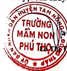
Trương Mâm Non